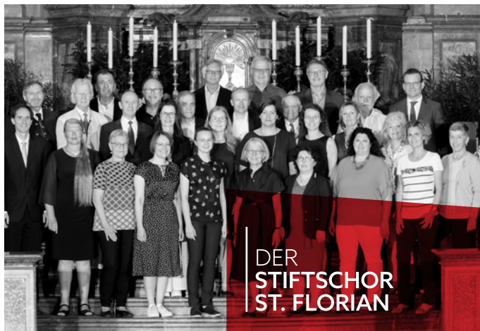
DER STIFTSCHOR ST. FLORIAN