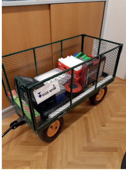
Abb. 9 und 10: Der Notfallwagen mit allen notwendigen Materialien (Foto: Benediktinerstift Melk).

5 Welche Materialien eine solche Notfallbox oder ein -wagen beinhalten sollte, führte kürzlich Larissa Rasinger in ihrem Beitrag näher aus: Larissa RASINGER, Notfallplanung und Notfallbox. Von der Theorie zur Praxis im Archiv des Schottenstifts, in: Mitteilungen des Referats für die Kulturgüter der Orden 3 (2018) 33–44, insb. 42, online unter: https://www.ordensgemeinschaften.at/kultur/images/MiRKO/2018mirko_33-44_rasinger.pdf