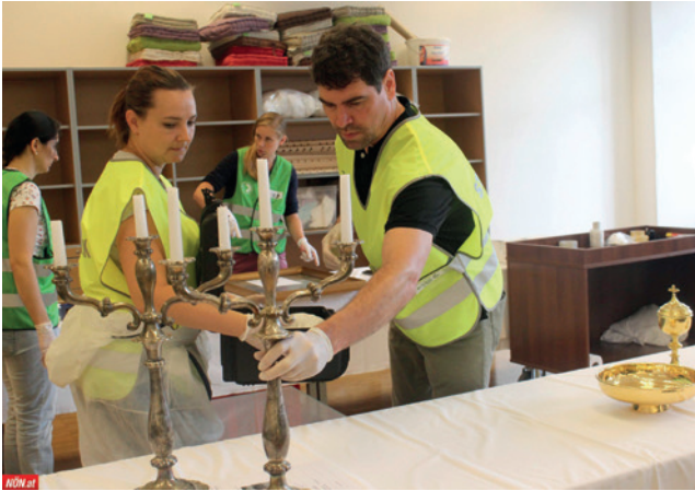
Abb. 4: Die Teilnehmer*innen der Kulturgüterschutzübung 2018 trugen farbige Westen.