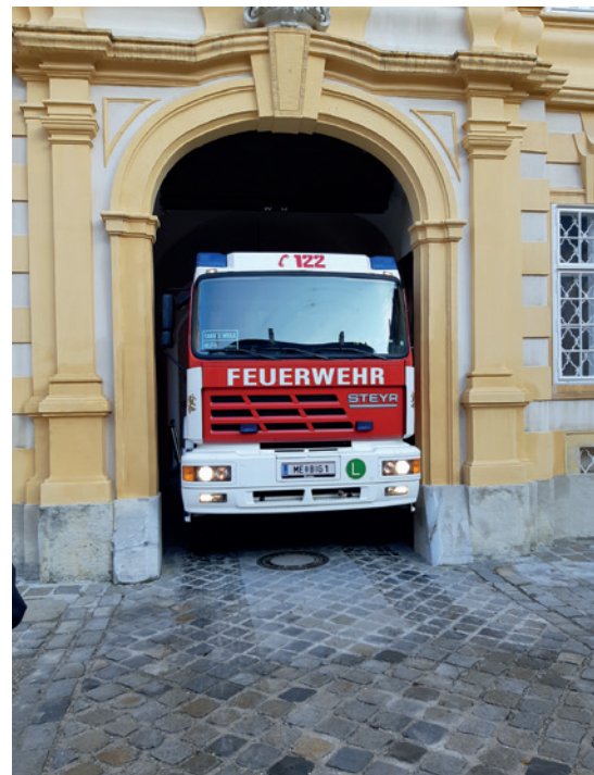
Abb. 1: Ein Einsatzfahrzeug der Feuerwehr Melk verlässt nach der Übung den Stiftshof.

Um diese Schätze auch für die Zukunft zu erhalten, verfügt das Stift Melk seit ein paar Jahren in der Person des Autors dieser Zeilen über einen eigenen Sicherheitsbeauftragten. Er kümmert sich um alle sicherheitsrelevanten Belange im Haus und legt viel Wert darauf, in allen Sicherheitsfragen und bei der Notfallplanung eng mit den lokalen Einsatzkräften (Feuerwehr, Polizei, Rettung, Bundesheer) zusammenzuarbeiten (Abb. 1).