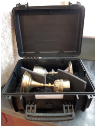
Abb. 11: In gepolsterten Boxen können besonders wertvolle Objekte sicher transportiert werden.

Grundsätzlich stellt die Inventarisierung einer Sammlung eine wichtige Maßnahme zu ihrer Sicherung dar. Inventare helfen auch bei der Diebstahlprävention bzw. zur Schadenserhebung. Diese kann auch durch eine Fotodokumentation jener Objekte, die sich in Regalen oder im Tresor befinden, ergänzt werden. So können die Objekte im Fall einer Evakuierung oder nach einem Diebstahl leichter als eigene Stücke identifiziert werden. Dabei ist es wichtig, Exemplare der Inventare und Fotodokumentationen (auch in ausgedruckter Form) im Notfallkoffer oder in der Notfallbox aufzubewahren, für den Fall, dass manche Gebäudeteile oder Büros im Notfall nicht betreten werden können.