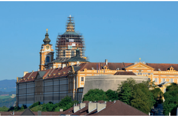
Abb. 2: Der Brand der Stiftskuppel 1947 (Foto: Benediktinerstift Melk).

Seitdem ist es zum Glück nur noch zu kleineren Bränden im Stift gekommen, zuletzt 2010, die aber alle erfreulicherweise keine großen Schäden verursacht haben. Auch auf internationaler Ebene zeigt sich, dass man vor Großbränden nie gefeit ist, aber dass man mit kluger Notfallplanung die Schäden begrenzen kann: Im Jahr 2019 beim Brand der Kathedrale Notre Dame in Paris wurde die große Bedeutung von Notfallplanung offensichtlich: Dank der vorhandenen Evakuierungspläne konnten 90% der beweglichen Objekte aus der brennenden Kathedrale gerettet werden.