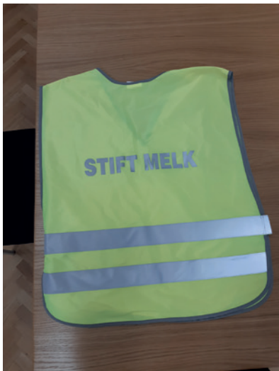
Abb. 5: Die gelbe Weste weist beteiligte Mitarbeiter*innen und Helfer*innen des Stiftes Melk aus.

des Stifts einbezogen: Sie werden im Umgang mit Feuerlöschern geschult und üben die richtige Handhabung der wertvollen Objekte für den Ernstfall einer Evakuierung. Eine große Kulturgüterschutzübung fand im Jahr 2018 im Rahmen der Sommerakademie der Donau-Universität Krems im Stift Melk statt – mit Beteiligung der Feuerwehr, des Bundesheeres und der Polizei (Abb. 4). Um den Verlauf der Übungen und die Zusammenarbeit mit den Einsatzkräften zu vereinfachen, trugen alle Übungsteilnehmer*innen farbige Überbekleidung: Die Mitarbeiter*innen und Helfer*innen trugen gelbe Westen, die weiteren Übungsteilnehmer*innen grüne Westen (Abb. 4 und 5). Für den Einsatzleiter ist eine rote Weste vorgesehen (siehe Abb. 8).