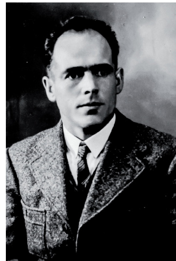
Abb. 1: Franz Jägerstätter, o.D.

Franz Jägerstätter (geb. 20.5.1907) gilt als einer der bekanntesten Kriegsdienstverweigerer in der Zeit des Nationalsozialismus. Der einfache Bauer und Familienvater lehnte den Nationalsozialismus aus christlichen Gesichtspunkten ab. Am 10. April 1938 stimmte Jägerstätter als einziger Bewohner seiner Innviertler Gemeinde St. Rade Gund gegen den „Anschluss“. Die Gemeindeverantwortlichen schützten ihn vor Repressalien. Im Zuge der militärischen Ausbildung 1940/41 sammelte er Erfahrungen, die ihm die Unvereinbarkeit von katholischer Morallehre mit dem Nationalsozialismus aufzeigten. So erfuhr er von der NS-Euthanasie, die als Aktion T4 bekannt wurde und den Repressionen gegen die Kirche. 1 Aufgrund von Frontberichten kam er zur Erkenntnis, dass der Krieg der deutschen Wehrmacht gemäß der traditionellen Lehre vom gerechten Krieg als „ungerecht“ einzustufen war und somit der soldatische Dienst für diesen abzulehnen war. Obwohl ihm Familie, Freunde, Priester und letztlich