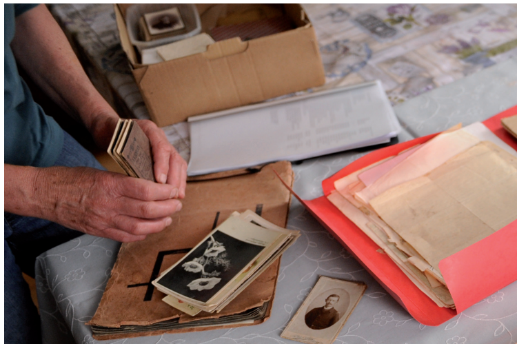
Abb. 4: In diesen privaten Nachlassmaterialien wurde ein bislang unbekanntes Jägerstätter Schriftstück entdeckt.