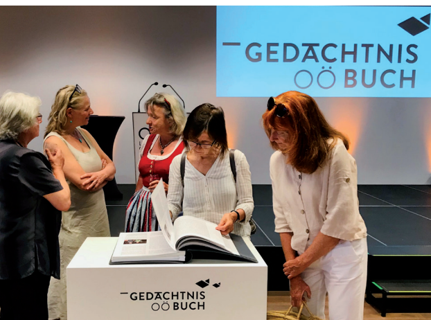
Abb. 3: Das Gedächtnisbuch Oberösterreich anlässlich der Präsentation am 19. Mai 2022 im Schlossmuseum Linz

Eines der ersten Projekte des FFJI, das sich um die Vermittlung bemüht und die regionale Erinnerungskultur stärken möchte, ist das Projekt „Gedächtnisbuch Oberösterreich“. 11 Dabei handelt es sich um eine fortlaufend erweiterte Sammlung von Biografien zu Personen, die im Nationalsozialismus aus den verschiedensten Gründen verfolgt waren oder durch widerständiges Handeln gegen das NS-Regime ihr Leben in Gefahr brachten. In einem jährlich statt-