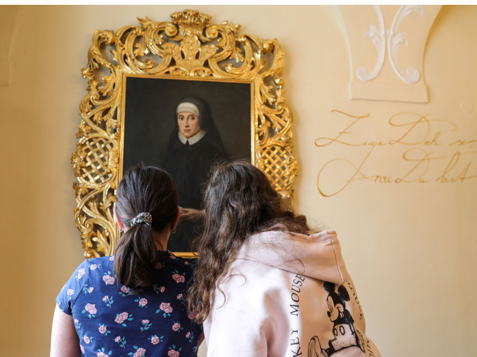
Abb. 5: Mary Ward Raum, Mädchen vor dem Porträt Mary Wards