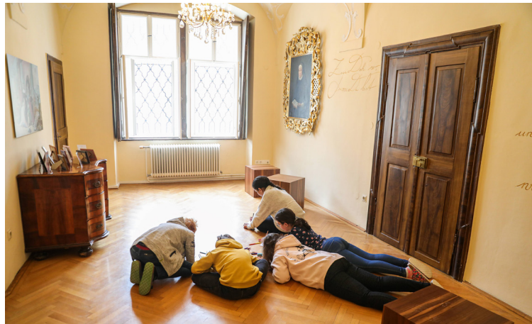
Abb. 1: Mary Ward Raum, Einblick - Kinder während eines Workshops

Wie kann Ordenscharisma ins Heute übersetzt werden? Der „Gründer:innenraum“ in den Mary Ward Schulen St. Pölten, ein bislang beispielloses Pilotprojekt, soll genau dies möglich machen. Der „Mary Ward Raum“ dient als interaktiver Raum für die Vermittlung des Ordenscharismas Mary Wards (*1585, †1645) an Schüler:innen, Pädagog:innen, Eltern und Absolvent:innen der Mary Ward Schulen in St. Pölten und Krems. Er entstand als Gemeinschaftsprojekt der beiden Schulstandorte, des Schulerhalters, der Vereinigung von Ordenschulen Österreichs (VOSÖ) 1 und dem Bereich Kultur und Dokumentation der Österreichischen Ordenskonferenz.