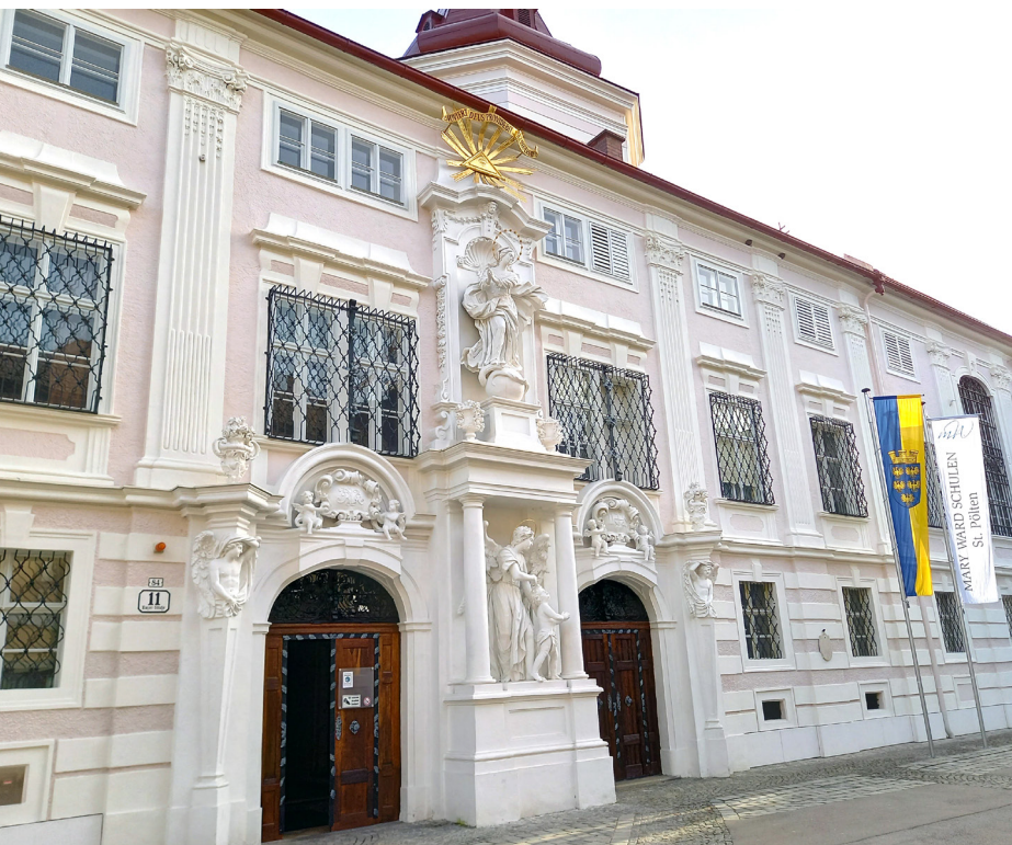
Abb. 3: Mary Ward Schulen St. Pölten, Außenansicht