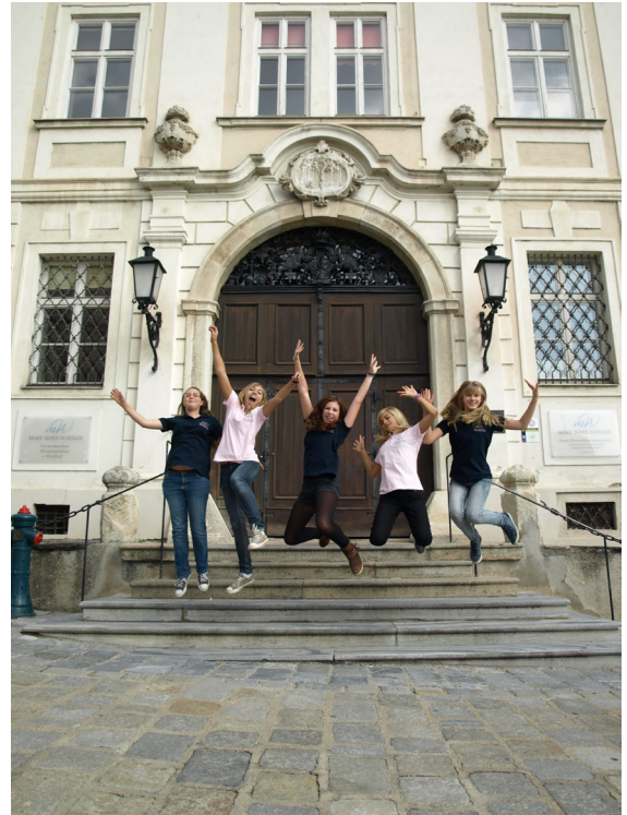
Abb. 4: Mary Ward Schulen Krems, Außenansicht

Zwei Jahre nach Eröffnung des Ordensgründer:innenraumes ist sichtbar, dass diese Zielsetzung der beiden Leitungsteams in vielseitiger Hinsicht realisiert wurde. Als Beispiele für die Nutzung des Gründer:innenraums von unterschiedlichen Zielgruppen seien Workshops für Schüler:innen, Religionsunterricht mit Klassen, On-