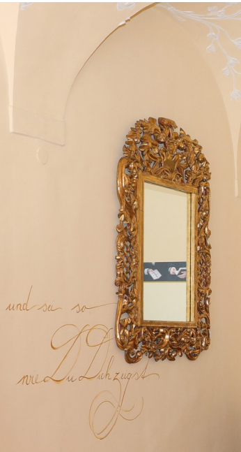
Abb. 7: Gründer:innenraum, Detail mit Barockspiegel und Teilen des Zitats Mary Wards

kein stiller Museumsraum sein soll, sondern ein Erlebnis- und Begegnungsraum. Neben dem Mary Ward Raum ist ein kleiner Gebetsraum situiert, der direkten Einblick in die barocke Klosterkirche gewährt. Um die Verbindung zur Bildungseinrichtung in Krems und deren Kirche aufzuzeigen, ist eine Fotografie der dort aufgestellten Schutzengelfigur sichtbar.